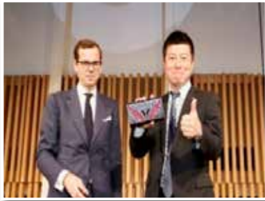
↑ GALA KANSAI 2018 ガラ・パーティー関西 2018の様